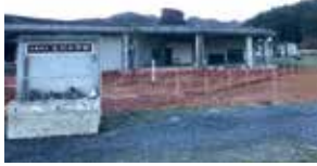
▲石巻市立大川小学校